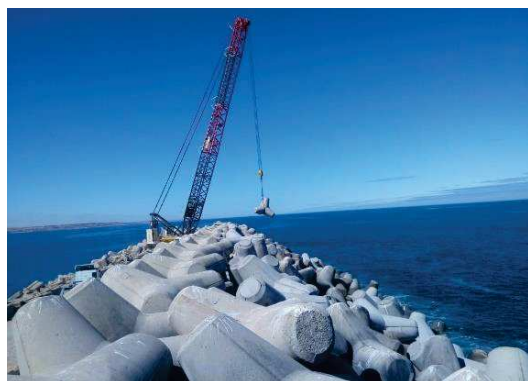
Résultat net ANP en MDHS