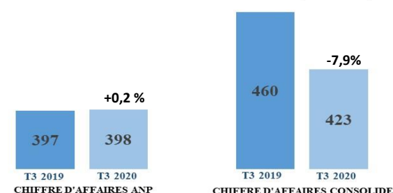
Evolution du Chiffre d'Affaires (en MDH)

Le chiffre d'affaires consolidé cumulé à fin Septembre 2020 est de 1 544 Millions de Dirhams , légèrement en hausse par rapport à la même période de l'année 2019 et ce, malgré le contexte de pandémie Covid-19 ayant impacté l'activité de la SGPTV.