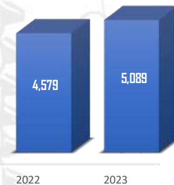
Endettement (En Mdh)

Pour accompagner la réalisation de ses projets, le Groupe Al Omrane a réalisé avec succès en 2023 une levée obligataire d'un montant de 1,2 milliard de dirhams. L'endettement s'établit à 5 089 Millions de DH à fin décembre 2023.