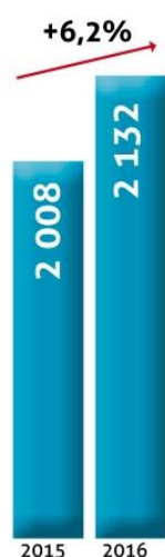
Chiffre d'affaires (en Millions Dh)