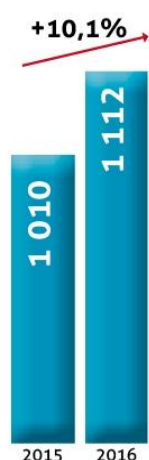
Chiffre d'affaires (en Millions Dh)