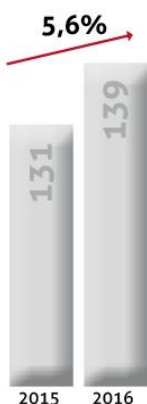
Résultats nets (en Millions Dh)

Le chiffre d'affaires consolidé a atteint 2 132 millions de dirhams, comparativement à 2 008 millions de dirhams, en hausse de 6.2% par rapport à la même période de 2015.