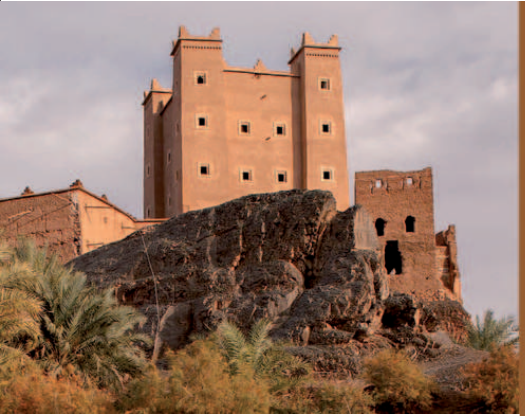
Kasbah Ait Hammou Ou Said, réhabilitée et transformée en école Medersat.com par la Fondation BMCE BANK