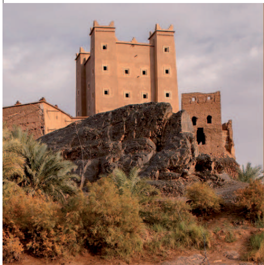
Kasbah Ait Hammou Ou Said, réhabilitée et transformée en école Medersat.com par la Fondation BMCE BANK