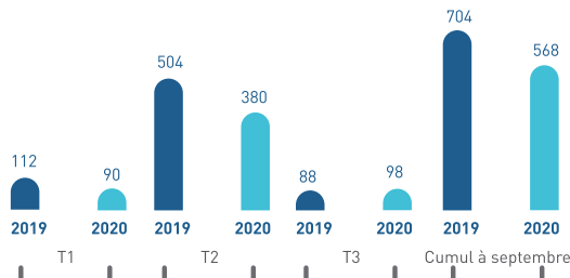
Chiffre d'affaires (en millions DH)

L'évolution du chiffre d'affaire par période se présente comme suit :