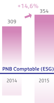
PNB Comptable (ESG)

Les marges et revenus des activités bancaires s'établissent à 354,5 MDH portés par la progression de la marge d'intérêts, des résultats des opérations de Location avec Option d'Achat ainsi que la marge sur commissions qui totalisent 351,7 MDhs en progression de 15,4% par rapport à 2014. Cette évolution tient également compte de la réduction des coûts de refinancement qui baissent de -11,4%.