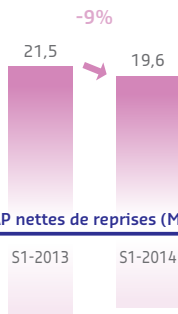
DAP nettes de reprises (MDH)