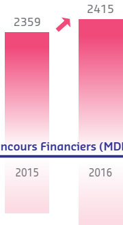
Encours Financiers (MDH)