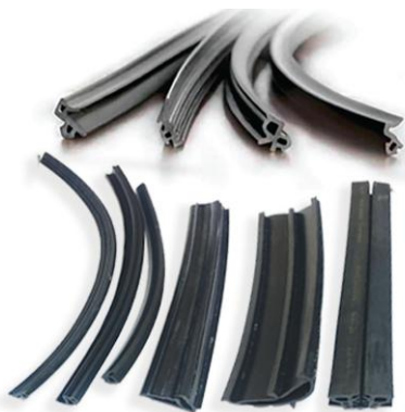
FIGURE 3 : JOINTS D'ÉTANCHÉITÉ POUR BATIMENT « TOITURES, FACADES, ... »