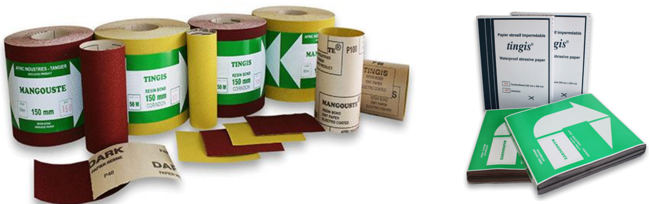
FIGURE 1 : PRODUITS ABRASIFS COMMERCIALISÉS PAR AFRIC INDUSTRIES S.A.