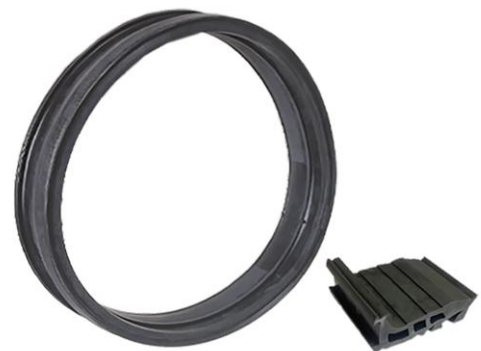
FIGURE 4 : JOINTS D'ÉTANCHÉITÉ POUR TUYAUX EN BÉTON