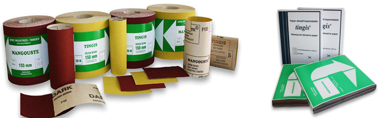
FIGURE 1 : PRODUITS ABRASIFS COMMERCIALISÉS PAR AFRIC INDUSTRIES S.A.