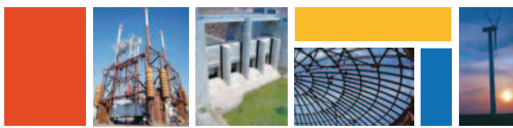
Tableau des immobilisations autres que financières exercice du 01/01/10 au 31/12/10