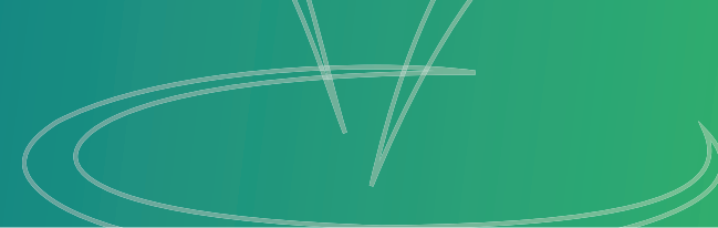
TABLEAU DES TITRES DE PARTICIPATION