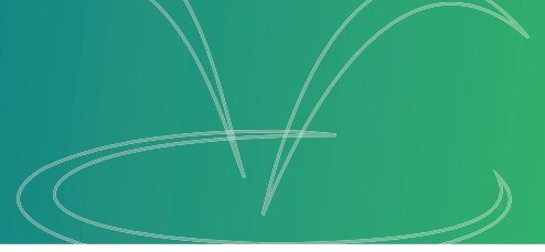
TABLEAU DES FLUX DE TRÉSORERIE